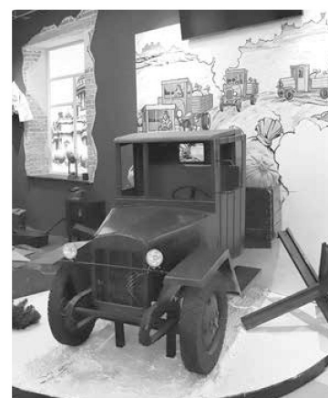
Макет легендарной полторы с Дороги жизни