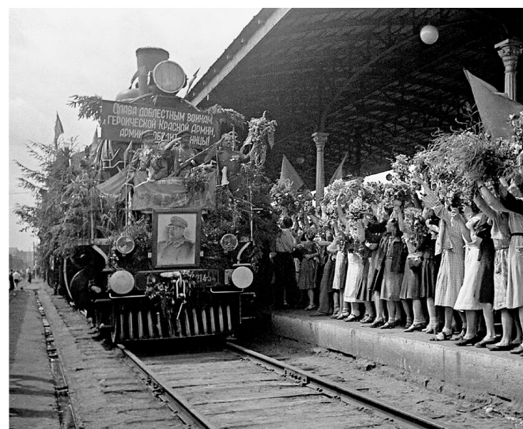
● Белорусский вокзал, 1945 год

Тогда режиссер поставил ультиматум: либо снимается Нина Ургант, либо он уходит вместе с ней. Режиссерское чутье его не подвело — на героине этой актрисы держа-