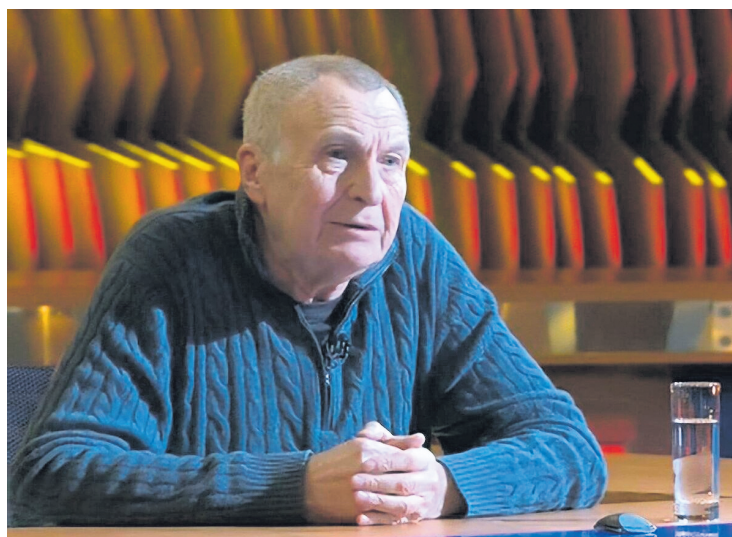
● Режисер фильма Андрей Смирнов

раз обвиняли в том, что он снимает «клеветническое и упадническое кино», из-за чего съемки останавливали четырежды! А сам Смирнов был убежден в том, что на самом деле снимает кино о стойкости и человечности ветеранов, о красоте их душ.