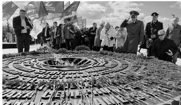
Участники акции почтили память мирных жителей, ставших жертвами фашистского геноцида

— Важно, что специалисты из других регионов, которые приезжают к нам, отлично взаимодействуют с местными поисковиками. Работа идёт бок о бок. Это позволяет нам ежегодно поднимать тысячи бойцов и командиров Красной армии, кото-